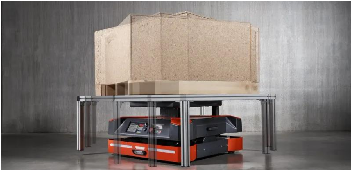
Abbildung 1: mobiler Roboter SAFELOG X1 Spin

Die HÖRMANN Intralogistics GmbH setzt ihre langjährige Zusammenarbeit mit der Liebensteiner Kartonagenwerk GmbH fort und freut sich, einen weiteren Folgeauftrag zur Erweiterung der Automatisierung am Standort Plößberg bekanntzugeben. Bereits in den Jahren 2010 und 2015 baute HÖRMANN für den Kunden jeweils ein 5-gassiges Fertigwaren-Hochregallager sowie ein 3-gassiges Rohwaren-Hochregallager, die mit dem HiLIS-Lagerverwaltungssystem und einer umfassenden Anlagensvisualisierung ausgestattet wurden. Nun wird der Automatisierungsgrad mit dem Einsatz mobiler Roboter weiter erhöht.