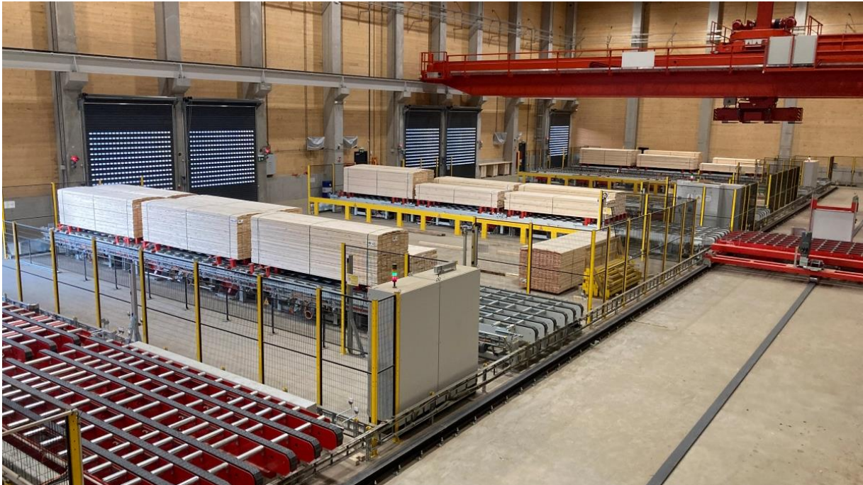
Abbildung 2 Halb-Automatische Trailerverladezone mit Modulbandförderern und Hubstempeln für bis zu 12 Tonnen

Bei den Ladeeinheiten handelt es sich um gebündelte Schnittholzpakete mit Abmessungen von bis zu 5,2 m Länge, 1,27 m Breite und 1,30 m Höhe, mit einem Gewicht von bis zu 3.200 kg. Um die Pakete sicher und materialschonend auf der Fördertechnik zu transportieren, verwendet HÖRMANN Intralogistics eine innovative Modulband-Fördertechnik aus hochwertigem, schmierölfreiem Kunststoff mit integrierten Transportrollen. Darauf können die Pakete mit und ohne Kanthölzer befördert werden. Bei der Übernahme vom Sortier- und Hobelwerk durchlaufen alle Pakete eine Gewichts- und Konturkontrolle.